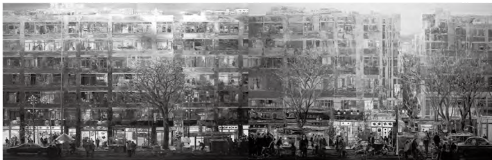
图1 黄润生：《万家灯火》，布面油画，120cm×400cm，2012年

暗对比关系；均匀分割的一个个窗户里，影影绰绰的住户们像在一个巨大舞台的不同空间里上演着不同的人生戏剧，其中，几个凭窗眺望者将大家的视线引向熙熙攘攘的街道。如果说两栋楼房是画面的主体，那么，《万家灯火》的前景则是街道上的行人、车辆和行道树。在这里，过街人群行色匆匆，人流如织，自行车、三轮车与小轿车等各式交通工具几乎将街道路面完全占据，灯火通明的沿街商铺与路边摆摊的行商走贩共同组成了当代中国最为常见的城市街景。画面上方尚未变黑的天空则无疑是这件作品的背景。在巨大的尺幅里，黄润生用他极富表现力的画笔不厌其烦、巨细靡遗地描绘出斑驳的墙面、窗台上的花卉、沿街商铺引人注目的店招和射灯……即使在画面上两栋小高层楼房中间那狭小的缝隙处，黄润生也往里塞满了数不清的行人、屋檐、灯火和树木。在这里，极尽繁多、密集甚至琐碎的视觉元素显得比真实街景的生活空间更能够典型地表现中国当代热闹、拥挤和喧嚣的城市景观——当然，我们在这里再次看到了中国乡土写实主义绘画“典型化”艺术观念和创作手法给黄润生留下的印迹。同时，这样的视觉效果也是此前“旧楼”系列作品的符号化探索的必然结果。在中国乡土绘画史上，无论在罗中立式，还是孙为民式、河南二段（段建伟和段正渠）抑或沂蒙王沂东式的乡土画面上，我们都还没有见到过黄润生这种绵密和繁杂的乡村图像。在这个意义上，我们可以将黄润生写实主义“繁密街景”作品命名为中国当代“极多主义”新乡土绘画。