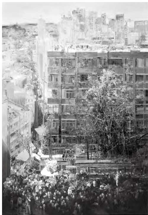
图4 黄润生：《高天厚地》，布面油画， 210cm×160cm，2014年

从20世纪中国乡土绘画图像的视觉趣味上来看，黄润生“重色调”绘画的艺术史前提显然指向曾经的“老苦旧”式的乡土绘画图景面貌。从作品语义效果来看，黄润生的“异在乡土”无疑走在差异化图像逻辑的创作进路之上。众所周知，中国乡土